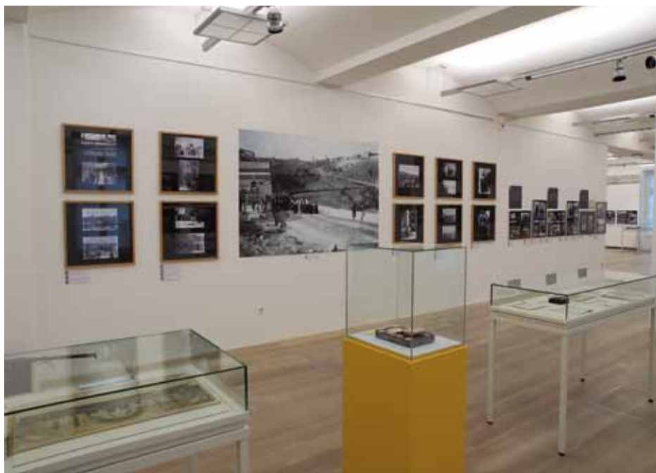
Fotografsko in predmetno gradivo z Nagličevih romanj v svete kraje.