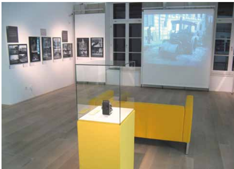
Projekcija Nagličevih fotografij in fotografski aparat, osrednji predmet drugega razstavnega prostora.