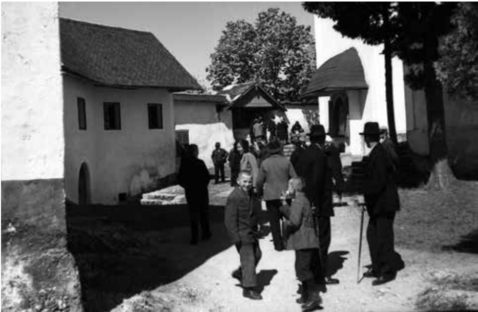
Romarji pred šmarnogorsko cerkvijo leta 1933

Tematsko lahko Nagličevo fotografijo v grobem razdelimo na portretno, krajinsko, arhitekturno in dokumentarno. Veliko večino njegovih posnetkov lahko uvrstimo v dokumentarno fotografijo, s katero je beležil tako vsakdanje kot tudi slovesne dogodke v ožji in širši okolici. Fotografiral je šege letnega in življenjskega kroga v svoji okolici, društveno in družabno življenje, domačo ščetarsko obrt in gradbene posege, povezane z njo, zabeležil je obdobje prve svetovne vojne, ki jo je preživel na Ljubljanskem gradu. Velik del Nagličeve dokumentarne fotografije pa lahko posredno ali neposredno povežemo z verskim življenjem in krščansko tematiko; v mislih imamo predvsem številna romanja, od bližnjih krajev pa vse do Jeruzalema, razne cerkvene slovesnosti in kongrese, blagoslove, pogrebe cerkvenih dostojanstvenikov in še bi lahko naštevali.